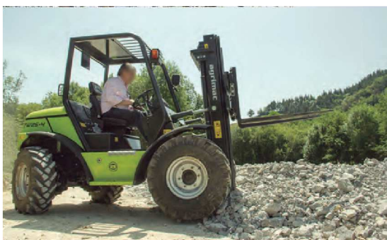
Conducción intuitiva y fácilmente maniobrable en cualquier situación